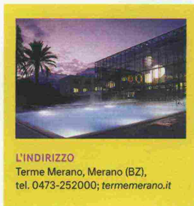
L'INDIRIZZO Terme Merano, Merano (BZ), tel. 0473-252000; termemerano.it