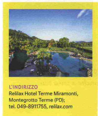
L'INDIRIZZO Relilax Hotel Terme Miramonti, Montegrotto Terme (PD); tel. 049-8911755, relilax.com

vicino allo stabilimento di Castellammare del Golfo (TP). Qui si posso fare bagni e fanghi caldi tra le suggestive rocce bianche striate di rosa.