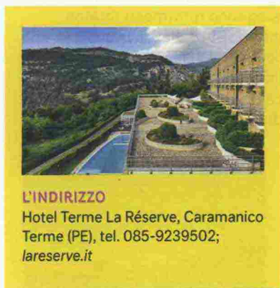
L'INDIRIZZO Hotel Terme La Réserve, Caramanico Terme (PE), tel. 085-9239502; lareserve.it